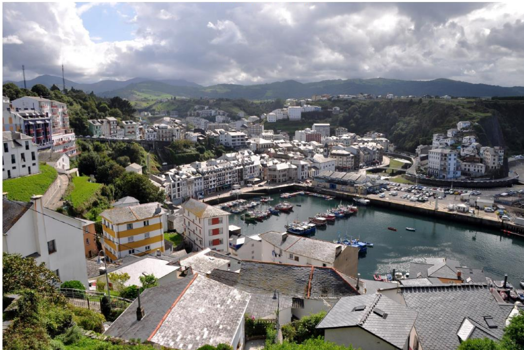
Luarca (Principado de Asturias)

Figura 2. Comente la fotografía adjunta atendiendo, si procediese, al siguiente orden: